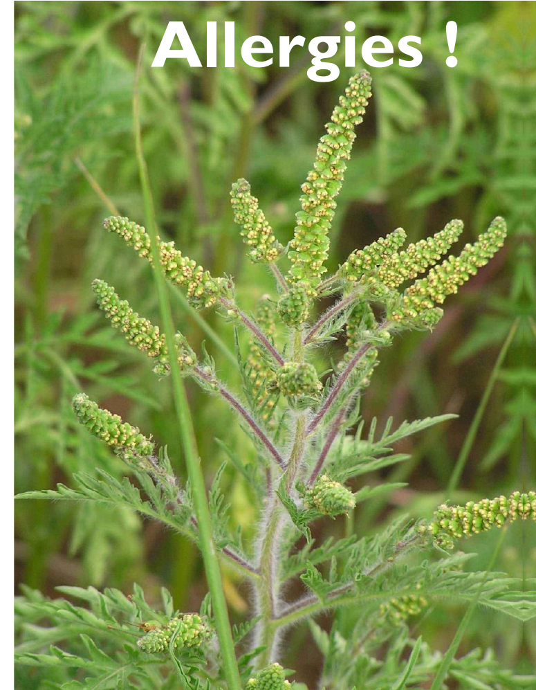
AMBROISIE À FEUILLES D'ARMOISE