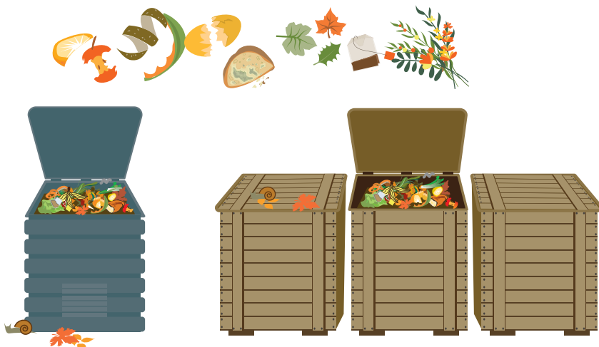
Composteur individuel en maison avec jardin

L'Agglo propose une solution adaptée à chacun, selon son secteur d'habitation.