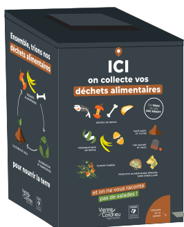
Borne de collecte en grands collectifs