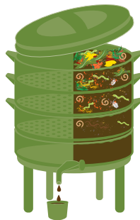
Lombricomposteur en appartement