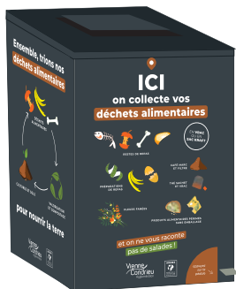
Borne de collecte en grands collectifs