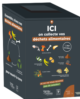
Borne de collecte en grands collectifs