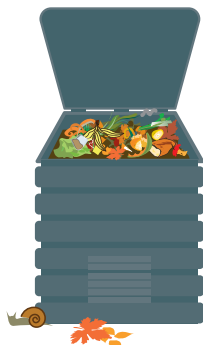
Composteur individuel en maison avec jardin