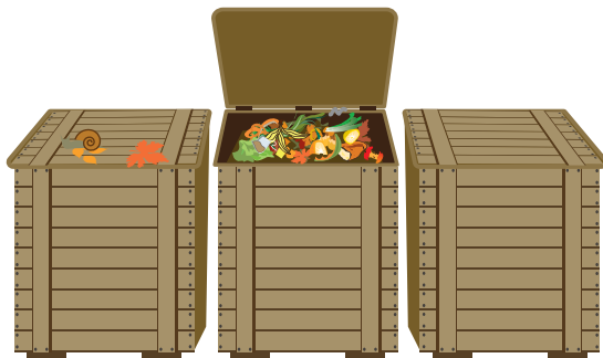
Composteur collectif en pied d'immeuble ou en établissement