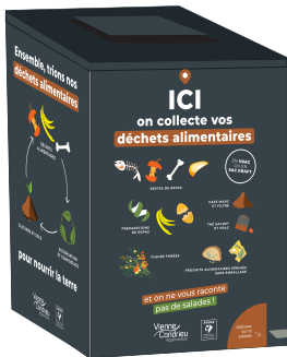
Borne de collecte en grands collectifs