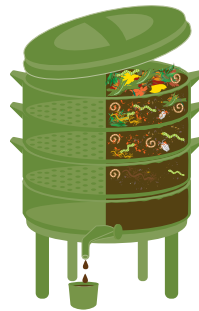
Lombricomposteur en appartement