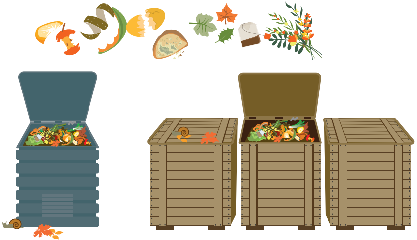
Composteur individuel en maison avec jardin

L'Agglo propose une solution adaptée à chacun, selon son secteur d'habitation.