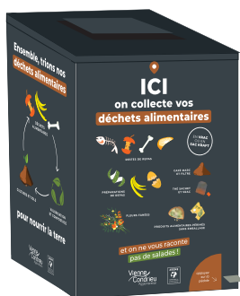
Borne de collecte en grands collectifs