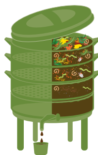
Lombricomposteur en appartement